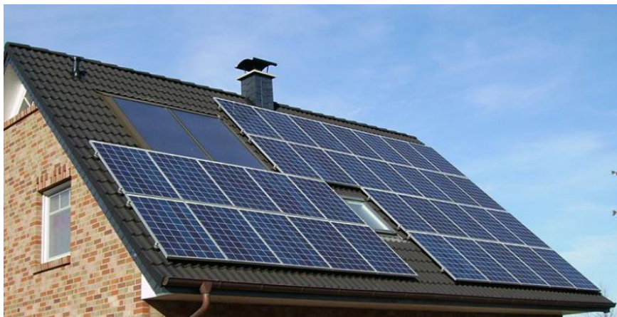
Слика 2-Фотонапонски систем монтиран на објекат Figure 2- Photovoltaic system mounted on the building

Фотонапонски соларни систем може да ради независно од електродистрибутивне мреже или да буде прикључен на њу. У зависности од компонената од којих се састоји, фотонапонски соларни систем који није прикључен за електродистрибутивну мрежу потрошачима може да даје једносмерну или наизменичну струју. Један овакав систем приказује Слика број 2.