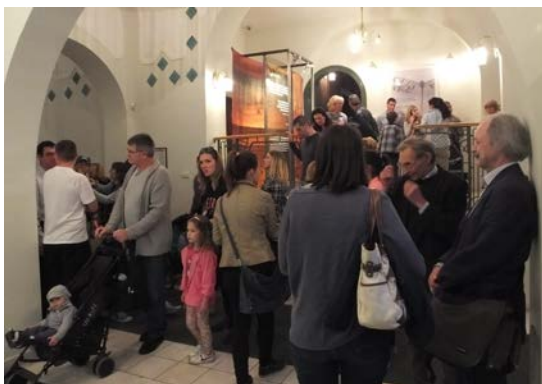
Слика 3. Отварање изложбе „Природа и сецесија“ у Градском Музеју у Суботици 2015. године

У пројекту „Сецесија и екологија“ пажња је била преусмерена са друштва на природно окружење са намером да се скрене пажња на пораст значаја екологије од времена сецесије до данас, да се испита однос сецесије и одрживог развоја, као и утицај климатских промена на баштину у стилу сецесије. У оквиру пројекта реализована је путујућа изложба „Природа сецесије“ ( The Nature of Art Nouveau ) која уводи посетиоца у процесе и различите фазе прераде материјала из природе у уметничка остварења. Ова изложба путује од једног до другог партнерског града од октобра 2013. године (слика 3). У оквиру пројекта је био организован међународни симпозијум, мултилатералне размене, припремљене су различите публикације, остварене различите активности младих on-line , итд