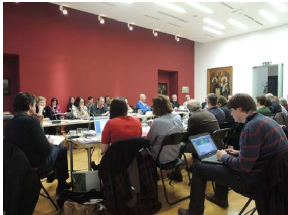
Слика 4. Генерална скупштина Мреже градова сецесије у Љубљани 2015. године

мултилатералне размене, мултимедијални перформанси, као и изложба „Природа и сецесија“ који су сви имали значајног одјека на ширу публику у сваком граду, укључујући велики број посетилаца који је бројао у неким срединама и више хиљада људи. У међувремену, нови градови су се придружили Мрежи, тако да је у дужим или краћим интервалима у Мрежи било учлањено двадесет четири града један регион и једна провинција, међу којима су и Хавана и Мелија, чиме се Мрежа градова сецесије проширила изван граница Европе (слика 4). У оквиру пројеката посебан напор је уложен у приближавање баштине у стилу сецесије деци и слабовидим особама.