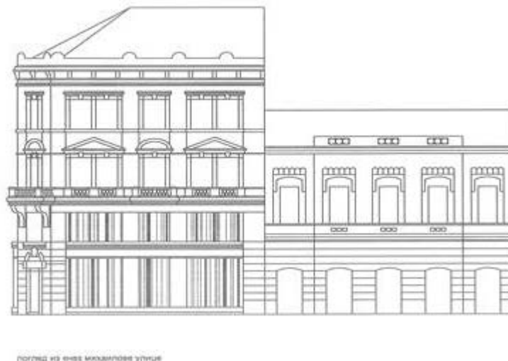
Слика 5 – Идејни пројекат културног центра – изглед из Кнез Михаилове улице (цртеж: Марко Николић, према Архиви града Београда постојећег стања)

На делу приземља и првог спрата, тј. мезанина, фасаду чине стаклене површине (излози) које се оживљавају са унутрашње стране лаким покретним паноима различитих боја у комбинацији са дизајнираним словним знаковима различите величине. На тај начин се ове стаклене површине оживљавају и чине привлачнијим. Остали део фасаде задржава свој аутентични изглед. (слика 5)