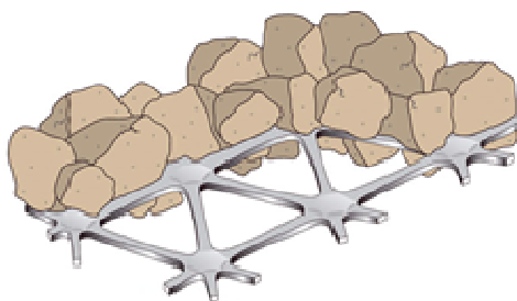
Slika 2. Uklještene zrna agregata pomoću geomreža

Geomreže za ojačanje putne infrastrukture i terena sadrži proizvode čija je primarna namena ojačanje infrastrukturnih objekata kao što su putevi, aerodromske piste, parkinzi, pruge i svi tereni preko kojih je frekventan saobraćaj i koji trpe veliki pritisak usled tereta. Uz pomoć ovih proizvoda vrši se kako ojačavanje putnog sloja (asfalta, betona, zemlje) tako i ujednačavanje prenošenja pritiska na podlogu i povećavanje površine na koju pritisak deluje (slika 2.), tako da sprečava pojavljivanje deformacije podloge (kao npr. kolotrazi na putu). Takođe se koriste i kod ojačavanja veštačkih bedemova napravljenih kako bi se sprečila erozija zemljišta i klizišta [2].