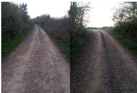
Slika 4. Postojeće stanje deonice od km 3+200.00 do km 4+818.88 km

Nakon stacionaže km 0+500.00 izvršeno je nasipanje drobljenog kamena sve do km 2+200.00, dok od stacionaže km 2+200.00 do km 3+200.00 nije izvršeno nasipanje drobljenog kamena. Od stacionaže km 3+200.00 do km 4+818.88 izvršeno je nasipanje drobljenog kamena (slika 4.), a od km 4+818.88 pa do kraja je asfaltni kolovoz. Širina postojećeg atarskog puta varira duž deonice. Usvojeno je da je prosečna širina puta 4.0m.