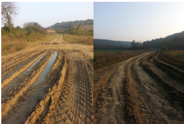
Slika 3. Postojeće stanje deonice od km 0+000.00 do km 0+500.00

Postojeća deonica predstavlja atarski put između sela Vizić i sela Erdevik, dakle ne postoji asfaltni zastor. Obilaskom trase je utvrđeno da drobljeni kamen nije nasut na celoj dužini deonice. Na prvih 500m deonice nije izvršeno nasipanje drobljenog kamena i praktično na tom delu je put neprohodan izuzev za poljoprivrednu mehanizaciju (slika 3.).