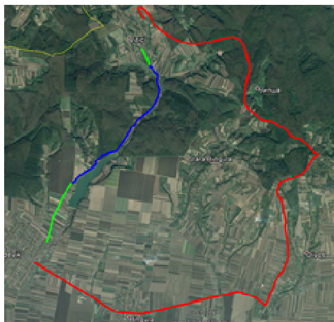
Slika 5. Prikaz postojeće veze Vizić-Erdevik i veze preko predmetne deonice

Na osnovu analize prikazanog postojećeg stanja zaključeno je da je predmetna deonica neprohodna, izuzev poljoprivredne mehanizacije, i na delu od 2+200,00 do 3+200,00 km, dakle na onim deonicama gde nije izvršeno nasipanje drobljenog kamena. Takođe je zaključeno i da je nasuti sloj drobljenog kamena na velikom delu deonice u dosta lošem stanju, odnosno da je neophodno izvršiti radove na saniranju postojećeg sloja. Predmetna deonica predstavlja jedinu direktnu vezu dve opštine (Bačka Palanka - Šid). Postojeća konekcija dve opštine je put Erdevik – Bingula – Divoš – Vizić što prelazi preko opštine Sremska Mitrovica i ukupna dužina je približno 21 km, dok je veza preko predmetne deonice ukupne dužine približno 7,5 km što predstavlja značajno skraćenje (slika 5.).