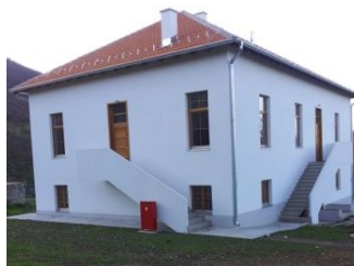
Слика 9., 10. Темељни остаци старе школе и новоизграђена школа у центру села