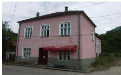
Слика 3. Дом културе