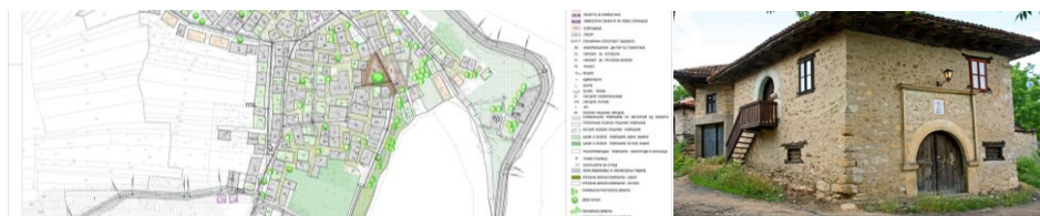
Слика 14., 15. Рајачке пивнице, План детаљне регулације и један од реконструисаних објеката – добар пример одрживе реконструкције насеља [5][11]

Систематска евиденција, израда документације и вредновање представљају приоритетни задатак истраживања, проучавања и установљавања споменичких вредности градитељског наслеђа. На основу резултата истраживања и валоризације градитељског наслеђа може се утврдити најрационалнија методологија даљих поступака, заснована како на мултидисциплинарним истраживањима и систематској анализи података и налаза, тако и на планирању санације затеченог стања, дефинисању полазишта за пројекте обнове, сагледавању циљева рехабилитације, ревитализације и потенцијала будућег развоја [5], [9], [11].