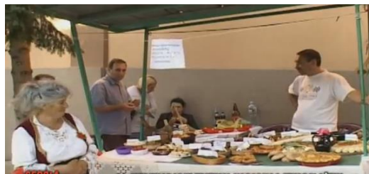
Слика 16. Традиционални фолклор Слика 17. Богатство традиционалне кухиње

Ручно ткане простирке на разбоју за ручно ткање, производ су једног од заборављених заната који се негује у бољевачком крају и представља посебну туристичку атракцију (слика 18.).