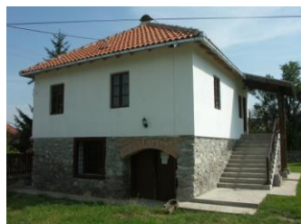
Слика 7., 8. Претходно стање куће и ревитализована завичајна кућа вајарке Љубинке Савић-Граси (Пројекат реконструкције арх. Љ. Алексић) [1]