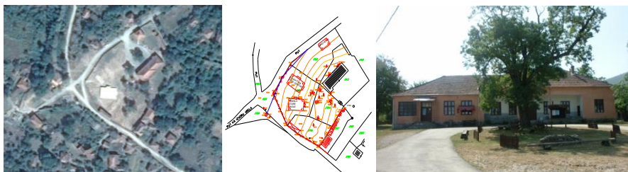
Слика 4., 5. Ситуација центра: снимак и ситуација Слика 6. Дом културе

Илино је село са незадовољавајућим демографским условима (105 пунолетних становника у 58 домаћинстава, а просечна старост становништва износи 55,7 година) и припада насељима IV ранга “остала насеља – примарна села” повезано асфалтним путем од 4,0 km са општинским центром.