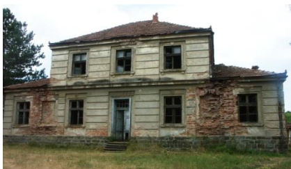
Слика 2. Напуштена зграда основне школе