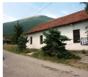
Слика 11. Основна школа